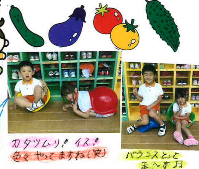
カタツムリ! イス! 色々やってみようね(笑) バランスととまへず月

「ビリボー」...という玩具です。バランス運動に良いですよ(^_^)/色んな使用方法がありそうでワクワクしています♡ 年令問わず、どのクラスでも楽しめていますよ(^^)