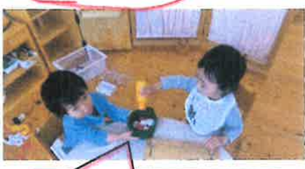
キッチンコーナー大好きな二人♪ 通じあって遊んでいる様子です