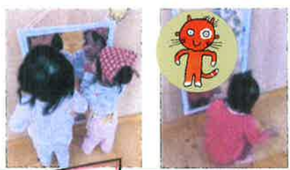
鏡シートで作った滑曲鏡！ 這ってみている自分を楽しんでいます