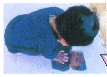
下から見える自分を楽しんでます