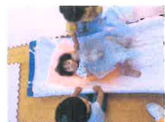
お世話コーナー、赤ちゃんのおむつを替えたり、一緒に寝てあげたり・・・大忙しのお母さん達(笑)