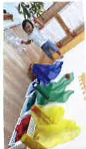
4色のつみこでオガシージーをキレイに並べて満足気♡