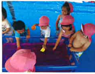
プール用の入浴剤のような物を入れて、こんなにキレイな色になりました。