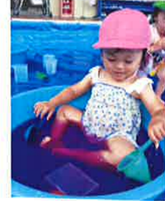
むらさき色のプール気持いいな〜♪