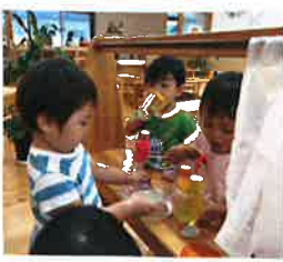
お部屋でもジュースさんごっこに夢中です