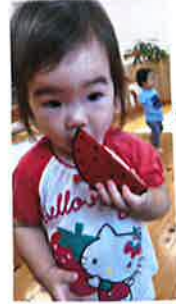
すいかいただきま〜す♡おいしいなあ♡