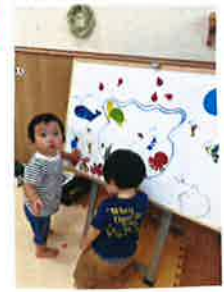
ホワイトボードの水族館ができました!