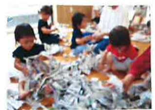
プレイルームで新仲間さんあそびをけいよ!