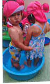
水が布くてちょっぴり不安な2人です。