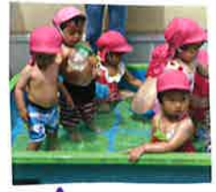
屋上プールデビューしました♪