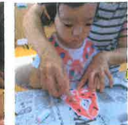
紙のお皿をスイカの皮に・・・?