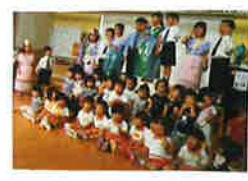
秋のコレクション展を見学しました。ファッションショーはとってもすてきでした♡