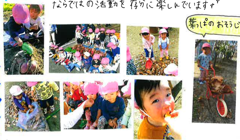
葉っぱのおそろじ♡

芋ほりに火焼き芋、葉っぱあそびなど、季節ならではの活動を存分に楽しんでいきます☆