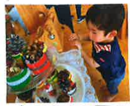
ケーキおいしそう...♡

自分の身のまわりのことを何でもチャレンジするしっかり者さんです。トイレットレーンクを元気で長びいて朝から、ポンツで過ごさせています😊