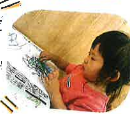
白画用紙にクレヨンを使って、なごりがきよ!!筆圧が弱くなりました!!何にはなるかは...お楽しみですよ!!