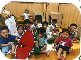
あにわにが、大好きなりすぐみ②の子どもたちです。絵本の世界を楽しんでくれて、とても嬉しいです♡優しい気持ちかたさん育っています♡これからあにわにとたくさん遊びたいと思ひます♡