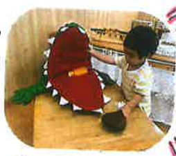
あにわに..にご飯を作ったり♡食べさせてあげたり♡お世話が上手です!!