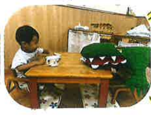
おやつtimeよ あにわににも一緒に食べています☺