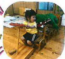
あにわに♡スキ♡スキ♡