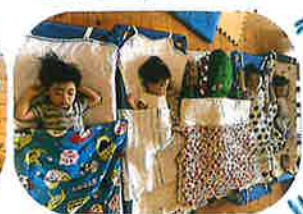
お昼寝も一緒にです♡あにわにの布団も絵本と同じ☆花柄です。