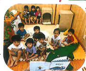
毎日の読み聞かせも!一着です♡絵本のある生活は、本当にステキです♡