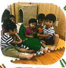
あにわにさん!!と名前を呼ぶとあにわにの手や足を挙げて「はい!!」と上げてくれます(笑)