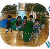
絵本の読み聞かせが大好きで、自然と子どもたちがあにわににも連れてきてくれます♡優しいなあ♡