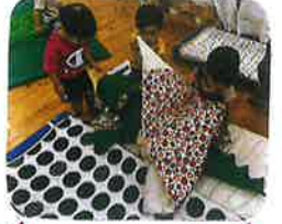
布団敷きも♡ 率先して!敷いて 寝かせてくれます♡