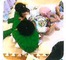
おににおに♡が とまりません♡(笑) おににおには♡ 幸せものです♡