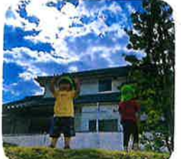
秋空の下から♡ 「ちゅほ〜♡!!」 戸外で過ごしやすい 時期になり嬉し そうです♡