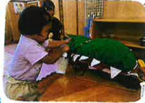
ままごとコーナーで、おににおの手♡に 「シュッ!シュッ!」と言って消毒をして あげています♡ 今日のご飯は、何かは〜??