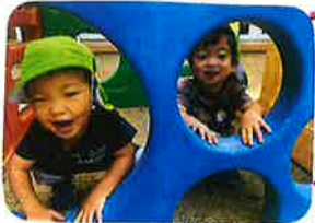
お気に入りの土場戸外から♡ 「ばあ〜♡!!」と 言ってお遊んでいます。