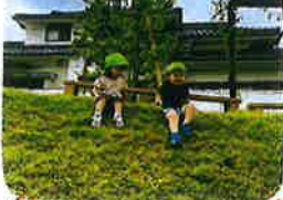
斜面をすべるのも♡ すべり台のよう♡ 上手ですよ♡