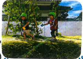
築山の上を走るだけで♡ とっても楽しく、2人で 大笑いでしたよ♡