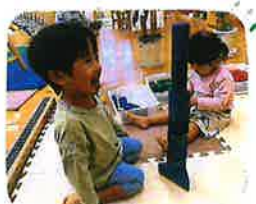
～積み木コーナー～ 同じ色で積んだり、自分の 背よりも高く積んだりと 積み木遊びを楽しんで います♡ 崩れても面白いのが積み木の 魅力ですよ♡