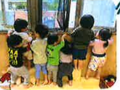
雨の日も...もちろん! 見に行きますよ! 大洗濯です♡(笑)