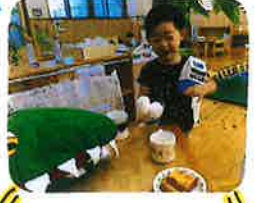
おやつを食べる時に、 おににおにも卵や 牛乳を冷蔵庫から 持ってきてくれます♡