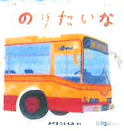
乗り物ゲームが 好きです♡ のりたいな♡と 思いたくなる 1冊です♡

保育士に見守られながら、衣服の着脱や排せなど、身の まわりのことを自分でしようとする。 散歩(テクテクタイム)や、戸外遊びで、探索活動をしたリ 身体を重かかして、存分に遊ぶ。