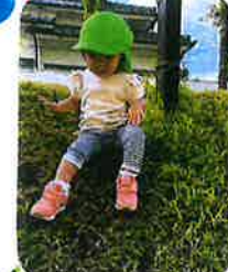
少しずつ園生活に 慣れてきました♡ 築山の斜面を1人で 何度も登り、すべり! 楽しんでいます♡