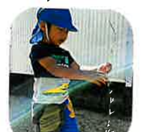
「菜生の茎」に... よまっています(笑)