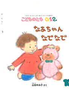
今月の 月刊絵本です♡

10/8(土)...運動会(予定)です!! ～詳細は、後日、お知らせします!～ りすぐみさん♡楽しく練習に 参加していますよ～♡