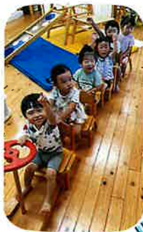
出発進行♪月 エイ!!エイ!!オー!!

気持ちの良い秋晴れの下、伸び伸びと身体を動かすことを楽しんでいる♡りすぐみの子どもたちです♡昼夜の気温差が大きい季節でもあるので、体調面に十分気を付けていきたいと思ひます。