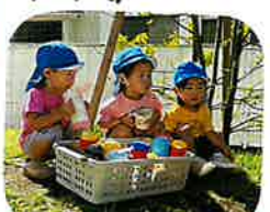
築山でのお茶会(笑)♡