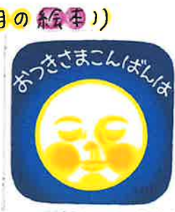
おつきさまこんばんは お月さまの 表情がとて 優しくあつ します♡ 裏表紙に描か れているお月さま が、お気に入り♡