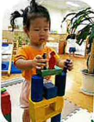
積み木遊びよ 人=形をした積み木 が、お気に入り♡