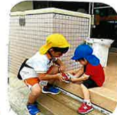
らいおん組さん♡(い)も優しくりすぐみ組さん おせ話をしてくれませう♡ ありがとう、♡