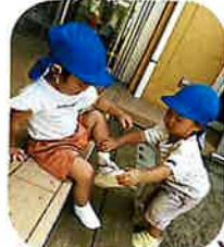
靴を履かせて あげようとしています♡