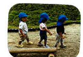
→「茎」をフタあげて... 電車に変身っ♡