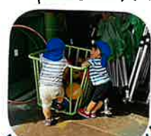
似ているフォルム(笑)♡