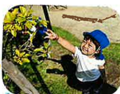
木の突き♡に、夢中～!! 枝もチェック(笑)!!