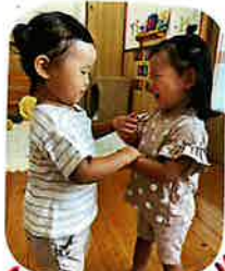
あらべうたよ “なべなべ”そめけ、そ してましたよ