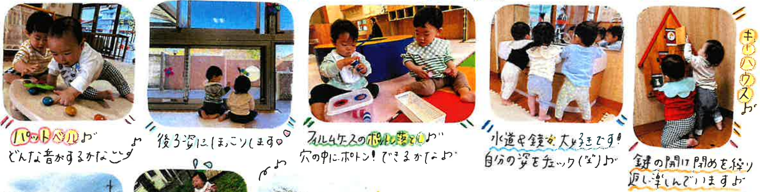
「パットパッド」 どんな音がするかな 後ろ姿に「まこ」 「ズルズル」の音 穴の中に「ポン」 水道を「鏡」 自分の姿を「ク」 鍵の「開け閉め」