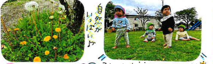
「自然がいっぱい」 それぞれが「ま」