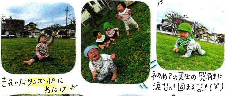
「まねのたんぽぽ」 初めての「芝生」 涙が「固まる」